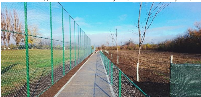
Teren sport – Comuna Movila Miresii

asocierii între Unitatea Administrativ-Teritorială Județul Brăila prin Consiliul Județean Brăila și Unitatea Administrativ-Teritorială Vișani, prin Consiliul Local al Comunei Vișani, pentru realizarea obiectivului de investiții “Amenajare Dispensar uman și unitate farmaceutică (farmacie comunitară), în localitatea Vișani, comuna Vișani;