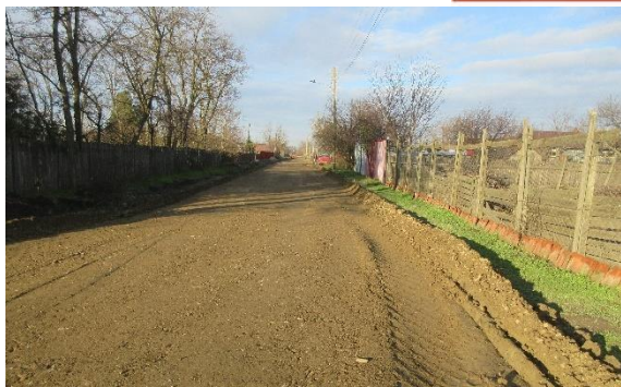
Str. Violetei – Comuna Bărăganul

- Hotărârea nr.141/14.08. 2025 privind: aprobarea finanțării programului sportiv “Karate tradițional” al Asociației Club Sportiv Tokon Dojo;