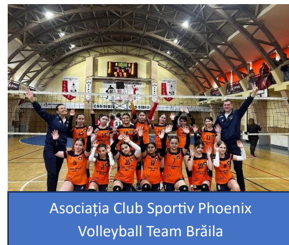
Asociația Club Sportiv Phoenix Volleyball Team Brăila

- Hotărârea nr.140/14.08.2025 privind: aprobarea finanțării programului sportiv “Volei pentru Brăila” al Asociației Club Sportiv Phoenix Volleyball Team Brăila;