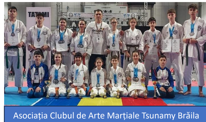
Asociația Clubul de Arte Marțiale Tsunami Brăila

- Hotărârea nr. 107/ 26.06. 2025 privind: aprobarea finanțării programului sportiv “Promovarea sportului de performanță”, al Asociației Clubul de Arte Marțiale Tsunami Brăila;