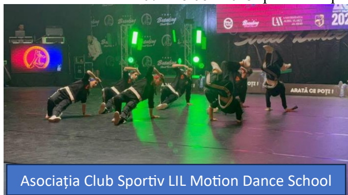
Asociația Club Sportiv LIL Motion Dance School

- Hotărârea nr. 108/26.06.2025 privind: aprobarea încheierii unui Acord între Unitatea Administrativ-Teritorială Județul Brăila prin Consiliul Județean Brăila și Unitatea Administrativ-Teritorială Comuna Stâncuta, în vederea realizării de către Comuna Stancuta a obiectivului de investiții “Amenajare trotuare și dispozitive pentru scurgerea apelor pe DJ 212