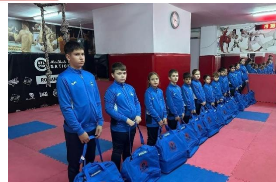
Asociația Club Sportiv Tokon Dojo

- Hotărârea nr. 172/30.09.2025 privind: aprobarea asocierii între Unitatea Administrativ-Teritorială Județul Brăila prin Consiliul Județean Brăila și Unitatea Administrativ-Teritorială Bărăganul, prin Consiliul Local al Comunei Bărăganul, pentru realizarea obiectivului de investiții “Modernizare strada Violetei și strada Panseluței în comuna Bărăganul, județul Brăila”;